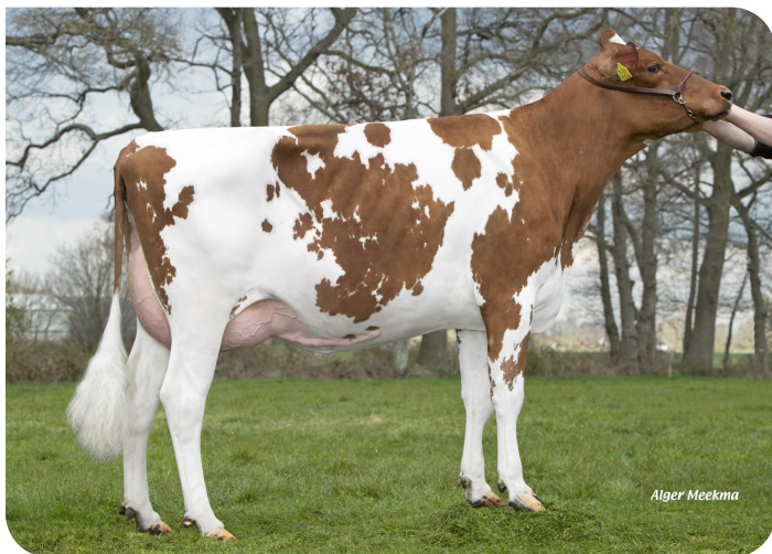
Hanny 71 (v. Macgyver) Eig.: Mts. Overeem, Lunteren