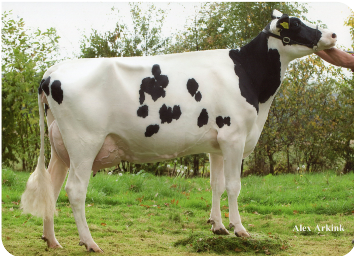
Massia 9397 RF van de Peul (AB 87) (grootmoeder van Macgyver)