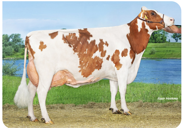
Grashoek Janna 155 (v. Macgyver van de Peul) (4e kalfs) Eig.: Fok- en melkveebedrijf K.I. Samen B.V., Grashoek