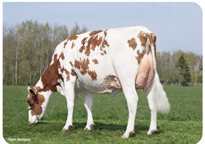
Grashoek Janna 155 (v. Macgyver) Eig.: Fok- en melkveebedrijf K.I. Samen B.V., Grashoek