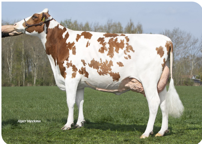
Grashoek Janna 155 (2e lact.) (v. Macgyver) Eig.: Fok- en melkveebedrijf K.I. Samen B.V., Grashoek