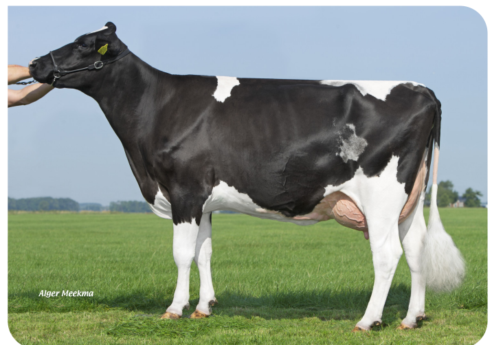
Koolstein Trijntje 493 (v. Fletcher) Eig.: VOF Kool, Appingedam