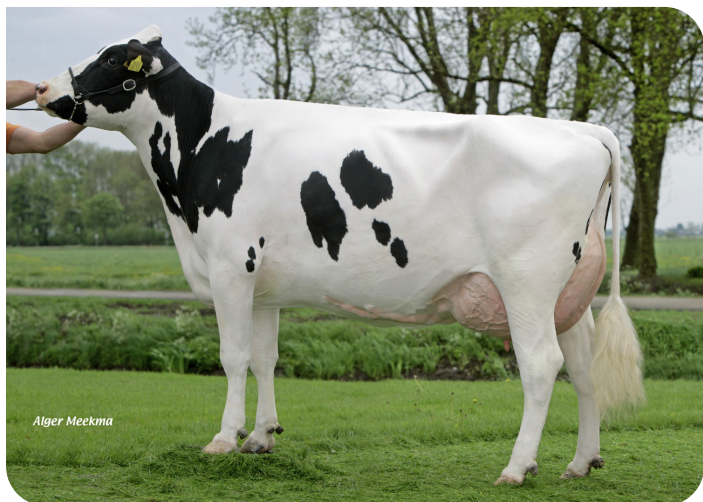
Mastenbroeker Akke 870 (A 90) (moeder van Fletcher)