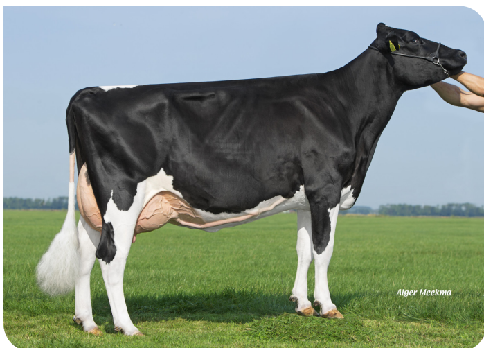
Koolstein Akke 183 (v. Fletcher) Eig.: VOF Kool, Appingedam