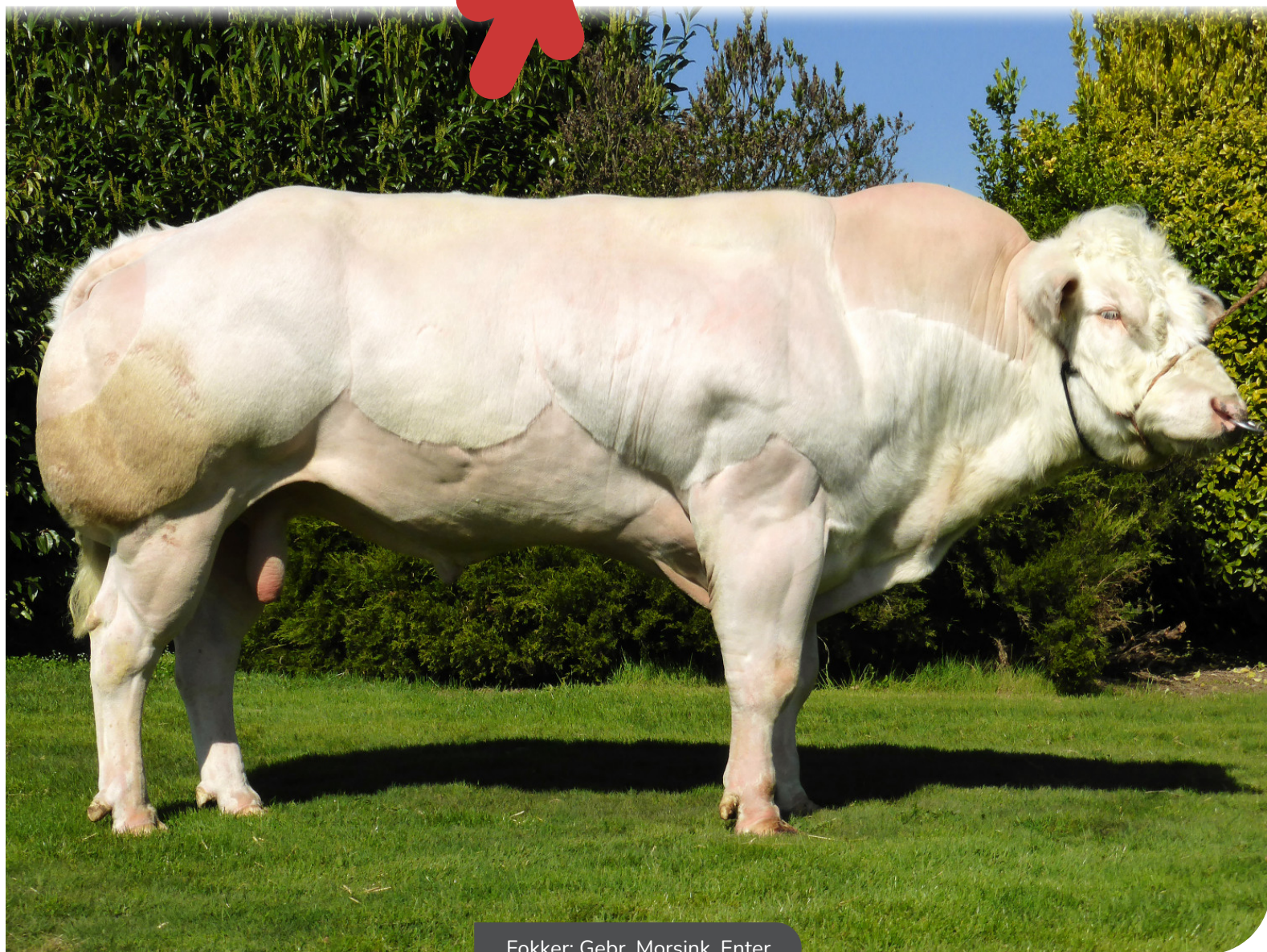
Fokker: Gebr. Morsink, Enter