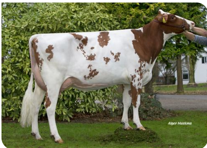
Rika 21 (v. Totilas)