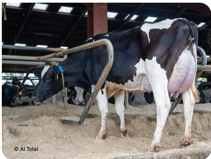
Dochter van Neal (2)