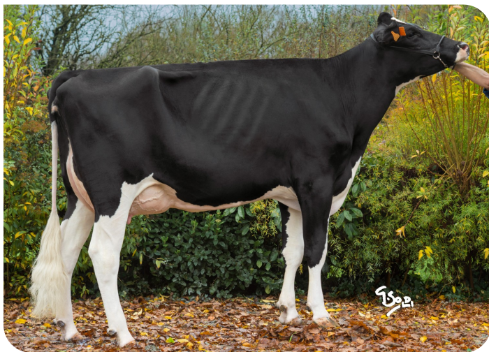
Ideale Grootmoeder van Neal