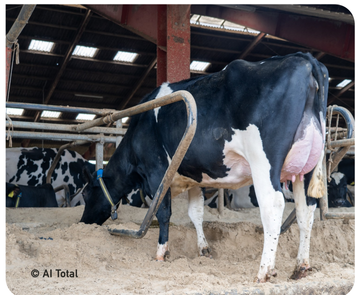
Dochter van Neal (1)