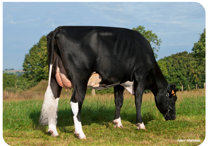
Falsamine Overgrootmoeder van Neal