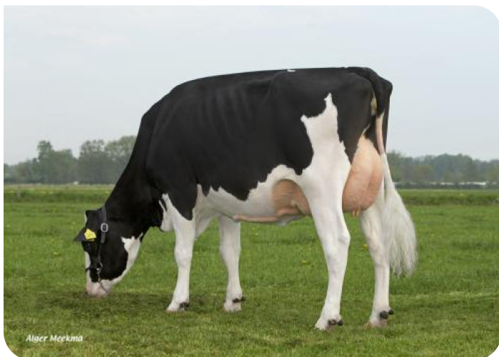
Autrice 3 (v. Action) Eig.: Dhr. H.A. Velderman, Loenen Gld.