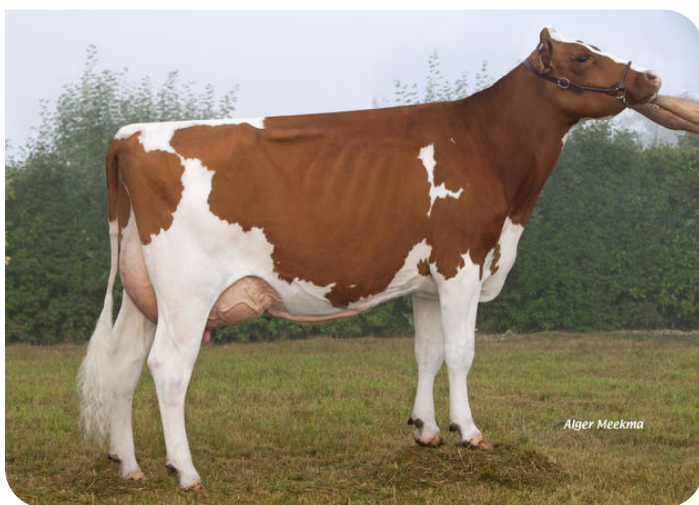
Fougere Overgrootmoeder van Okaidi Red