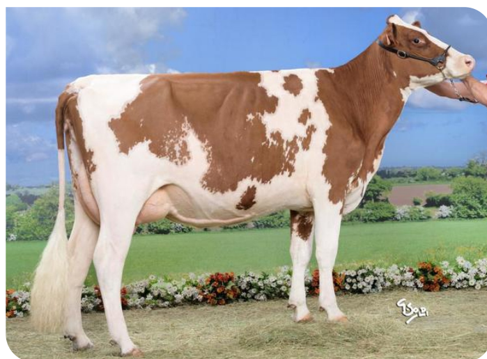
Sybelle (v. Okaidi Red)