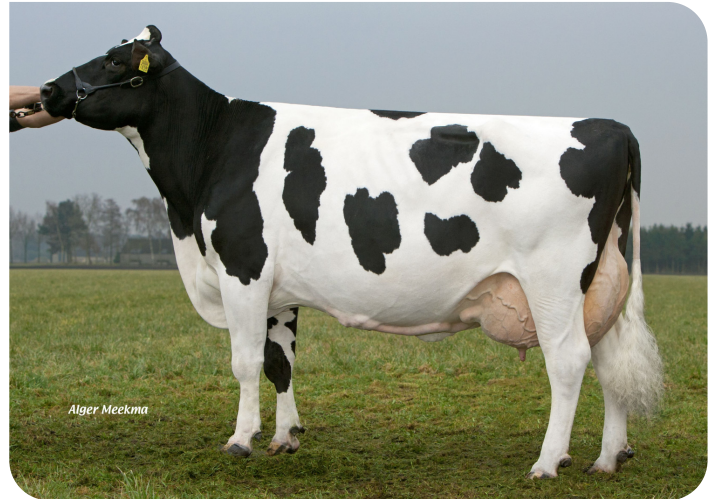
Peeldijker Liesje 738 (AB 89) (moeder van Outlaw)