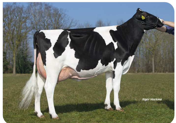
Grashoek Gredien 96 (v. Outlaw) Fig.: Melkveebedrijf Grashoek b.v., Grashoek