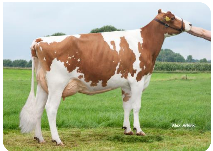
Cato 36 (v. Outlaw) Eig.: Dhr. F. Ordelman, Gelselaar