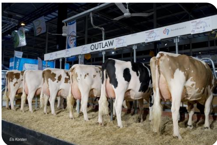
Dochtergroep Outlaw Gorinchem 2015