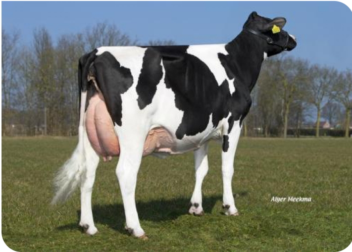
Grashoek Gredien 96 (v. Outlaw) Eig.: Melkveebedrijf Grashoek b.v., Grashoek