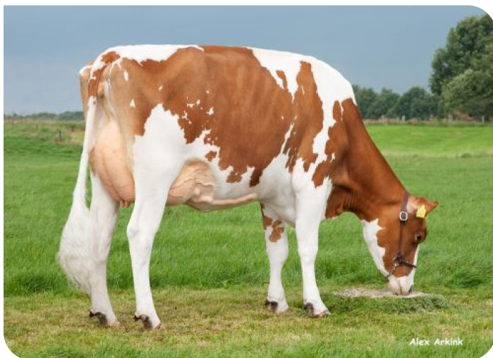
Cato 36 (v. Outlaw) Eig.: Dhr. F. Ordelman, Gelselaar