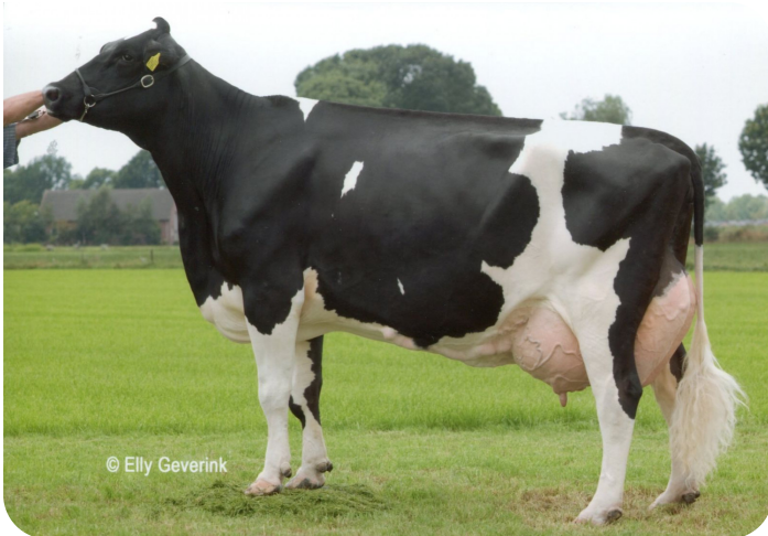
Peeldijker Liesje 385 (A 90) (overgrootmoeder van Outlaw)