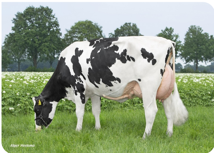
Peeldijker Liesje 1224 Grootmoeder van Pennywise

2.04 462dg 12745kg 5.12% 4.16% 3.10 325dg 12947kg 5.14% 3.91% 4.10 338dg 13301kg 5.20% 3.87% 5.10 376dg 12022kg 5.55% 4.20% 7.01 354LL 14713kg 5.14% 3.92% 86 88 88 86 AB 87