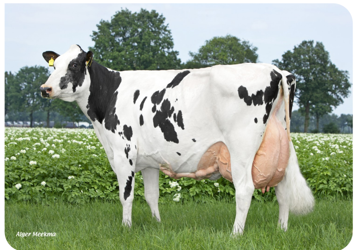
Peeldijker Liesje 992 Overgrootmoeder van Pennywise