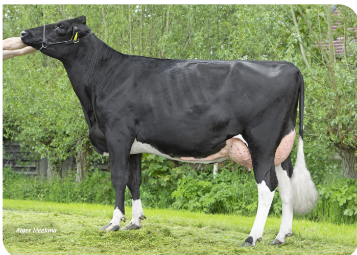
Plataan F 7888 (AB 87) Moeder van Faster