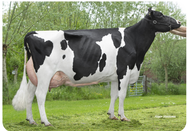
Plataan F7812 (VG 88) Moeder van Florus