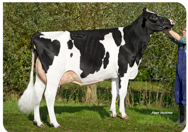
Plataan F7812 (AB 86) Moeder van Florus