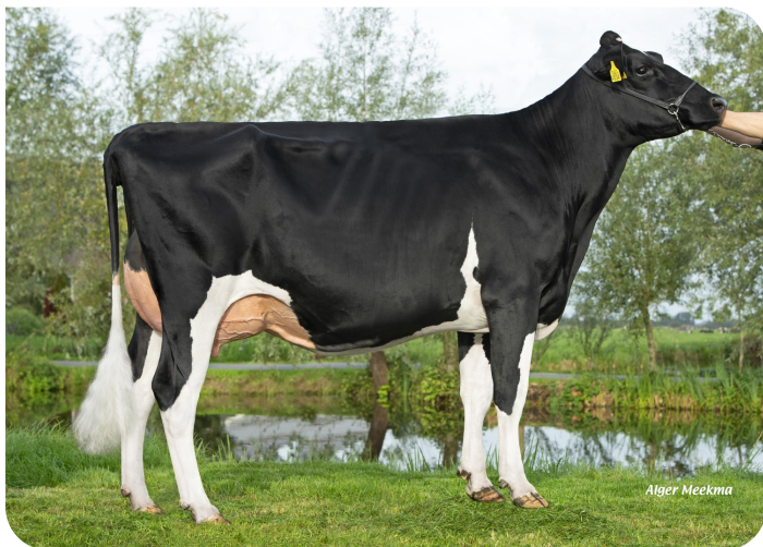
Nellie 258 (v. Florus) Eig.: V.O.F. J. Slingerland-van Dijk, Berkenwoude