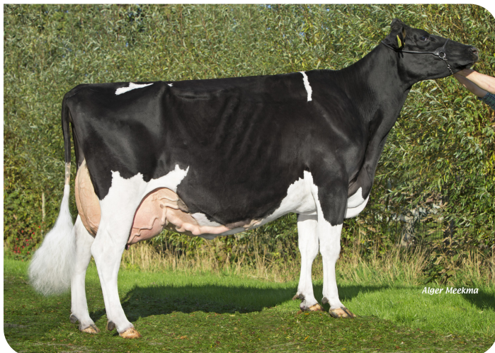
Plataan F8595 (AB 89) (grootmoeder van Florus)