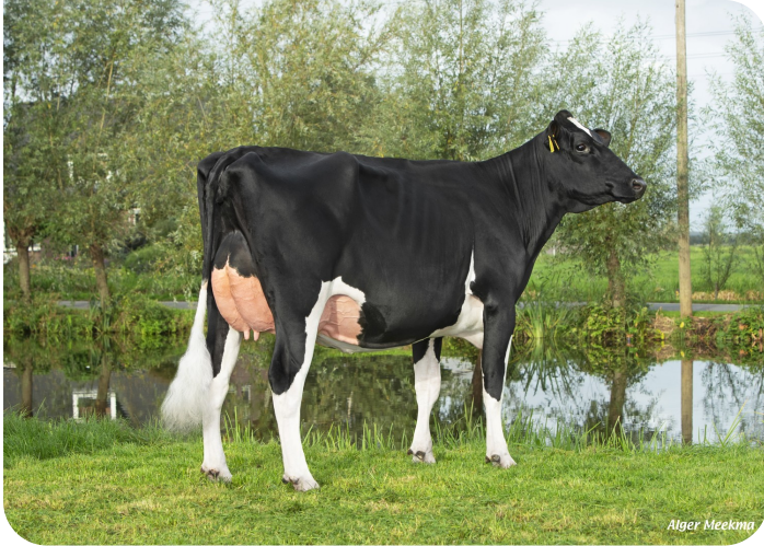
Nellie 258 (v. Florus)