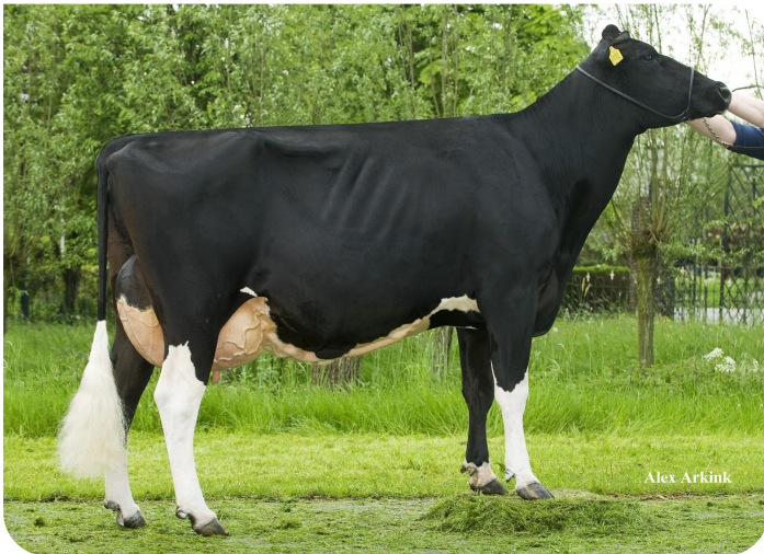
Plataan Frida 1 (AB 89) (overgrootmoeder van Friday)