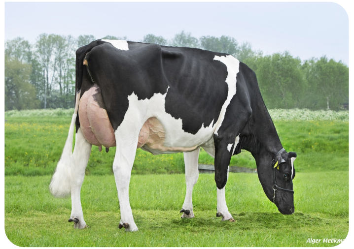
Annie 119 (v. Friday) Eig.: Fa. J. van Echtelt, Hoogwoud