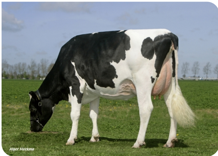
Sophie 180 (v. Maniac PS) Eig.: Dhr. M. Chattellon, Abbekerker