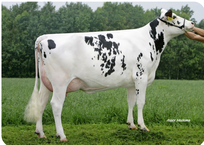
Fientje 785 (v. Sunflower PS rf) Eig.: Mts. Peeters, Kessel