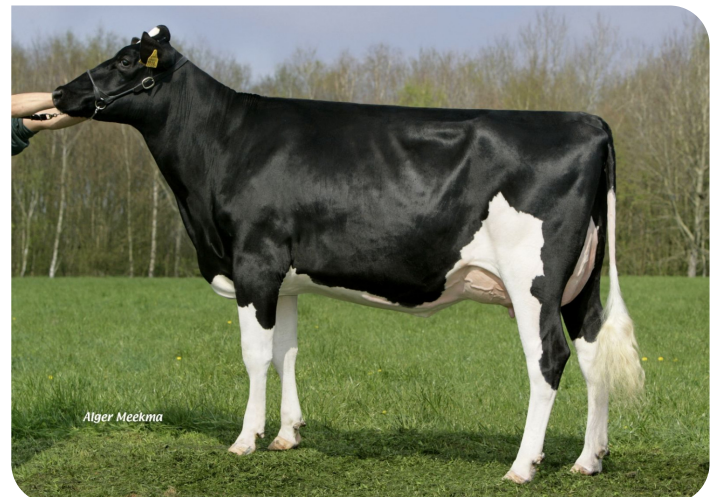
Grashoek Beaver 3 (AB 87) (v. Sunflower PS rf) Eig.: Melkveebedrijf Grashoek b.v., Grashoek