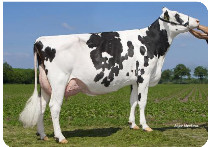
Grashoek Ruth 145 (AB 86) (v. Sunflower PS rf) (foto als 2de kalfs) Eig.: Melkveebedrijf Grashoek b.v., Grashoek