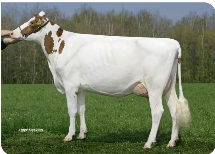
Grashoek Frieska 179 (AB 85) (v. Sunflower PS rf) Eig.: Melkveebedrijf Grashoek b.v., Grashoek