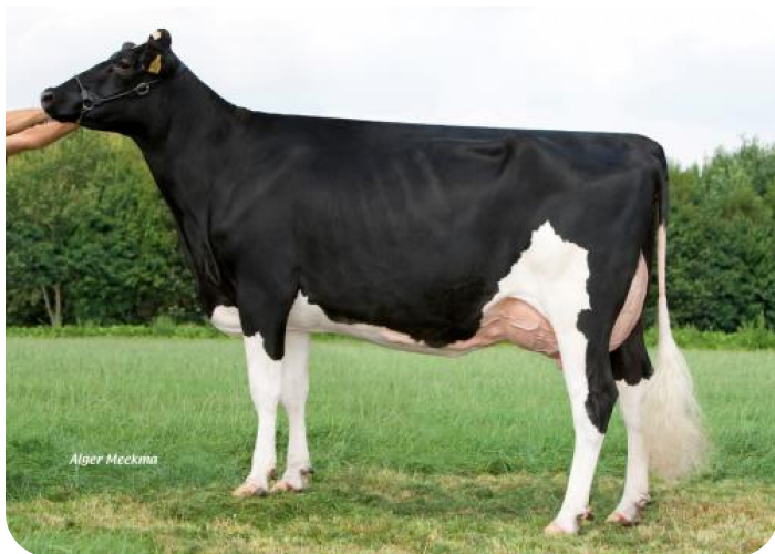
Grashoek Beaver 3 (A 90) (v. Sunflower PS rf) Eig.: Melkveebedrijf Grashoek b.v., Grashoek