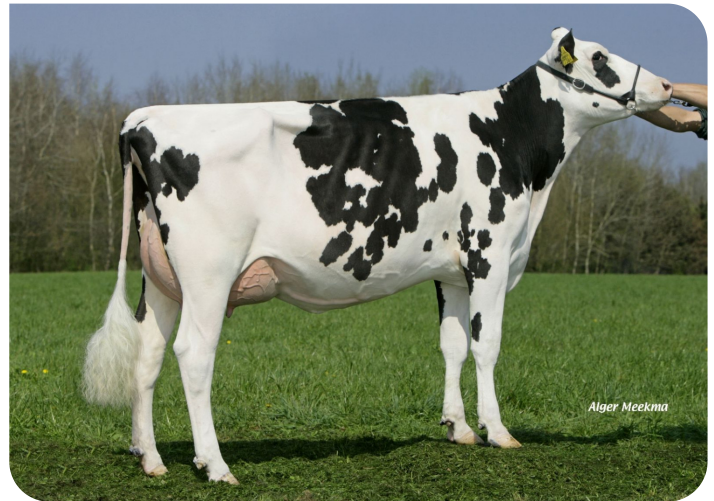
Grashoek Ruth 145 (AB 86) (v. Sunflower PS rf) Eig.: Melkveebedrijf Grashoek b.v., Grashoek