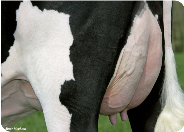
Uier van Grashoek Beaver 3 (v. Sunflower PS rf) Eig.: Melkveebedrijf Grashoek b.v., Grashoek