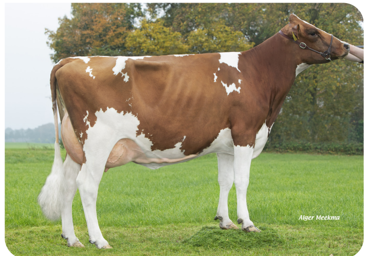
Sonja 112 (v. Fame P)

Eig.: Fok- en melkveebedrijf K.I. Samen B.V., Grashoek