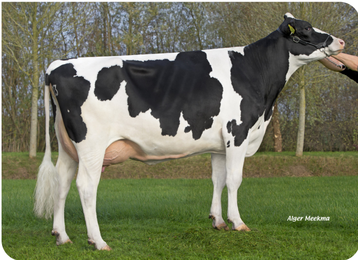
Poppe Fienchen 803 (AB 86) (Grootmoeder van Fame P)