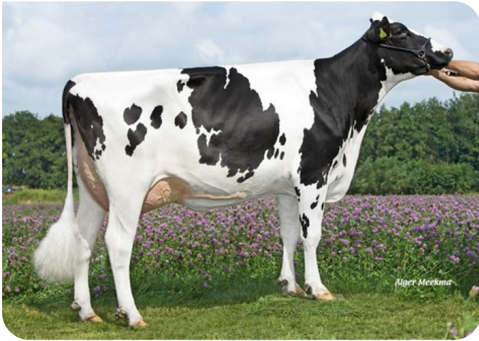
Wilder K41 RDC (AB 87) (Moeder van Kayne)