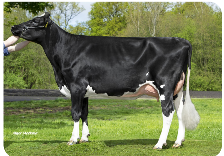
Diekers 3Star Ka Ida 3 (v. Kayne)