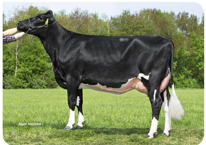
Grashoek Mona-Lisa 47 (V. Kayne) Eig.: Fok- en melkveebedrijf K.I. Samen B.V., Grashoek (NL)