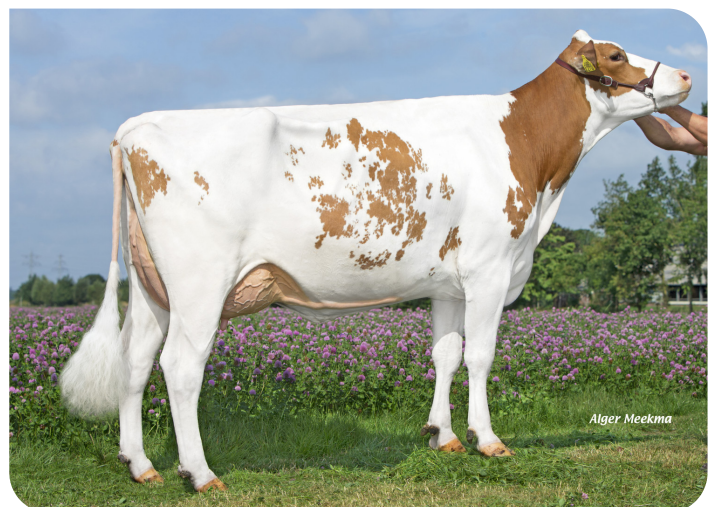
Poppe Fienchen 1270 (AB 86) (moeder van Magic Match Red)