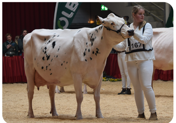
Irose 42 Moeder van Primrose