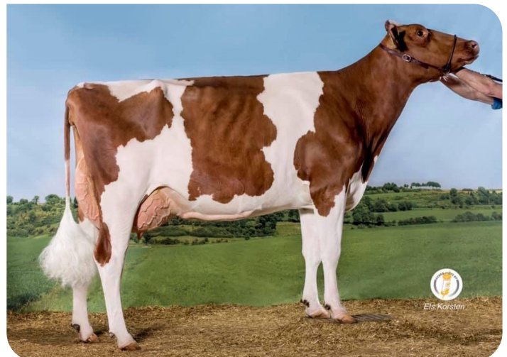
Elza 120 (AB 89) Grootmoeder van Rudolf Red