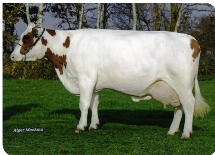
Gonda 277 (A 90) (grootmoeder van Ramon)