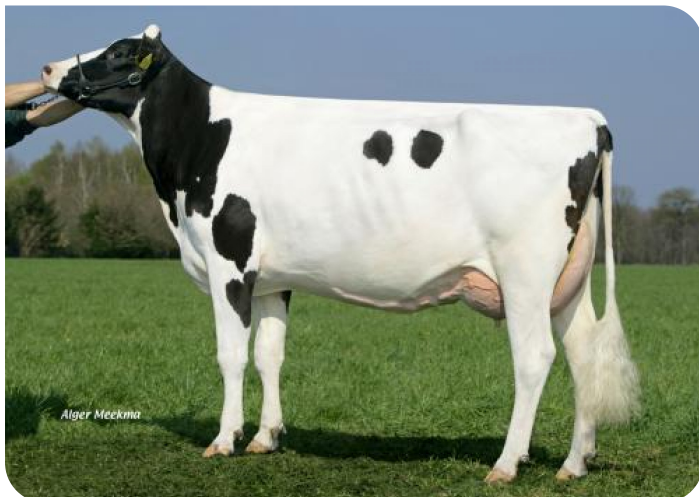
Everett 3 (AB 86) (v. Norwin rf) Eig.: Melkveehouderij Verwielen v.o.f., Hunsel