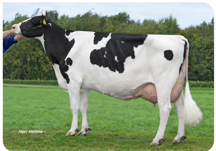
Wilgenhoeve Wizzy 3 (A90) (v. Norwin rf) (foto als 6de kalfs) Eig.: Mts. Groenen, Middelaar