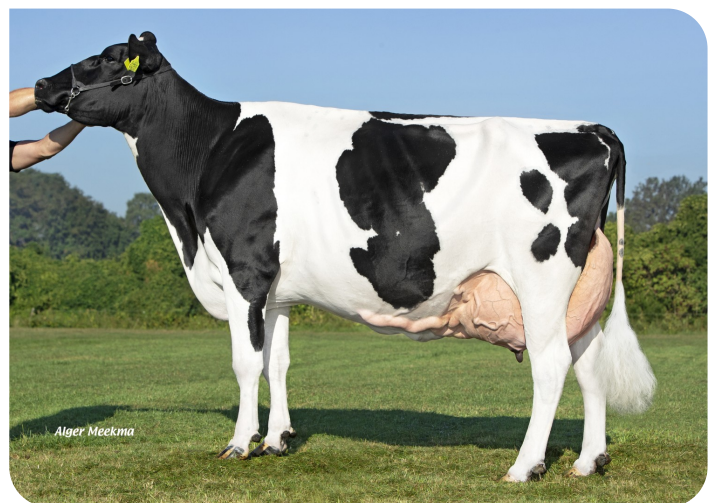
Hilda 6997 (EX 90) (Moeder van Skik)