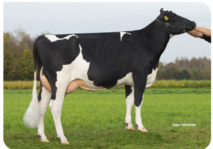
Grashoek Nel 138 (v. Arkansas) Eig.: Melkveebedrijf Grashoek b.v., Grashoek