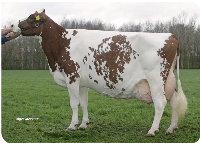
Mien 36 (AB 88) (moeder van Arkansas)