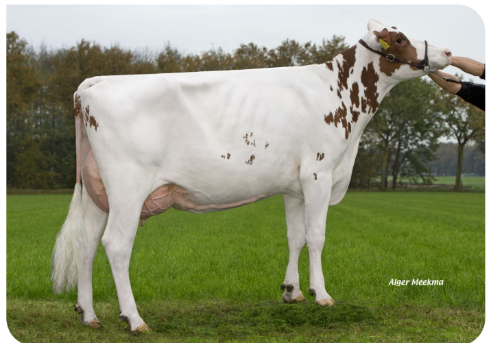
Grashoek Janna 119 (v. Arkansas) Eig.: Melkveebedrijf Grashoek b.v., Grashoek