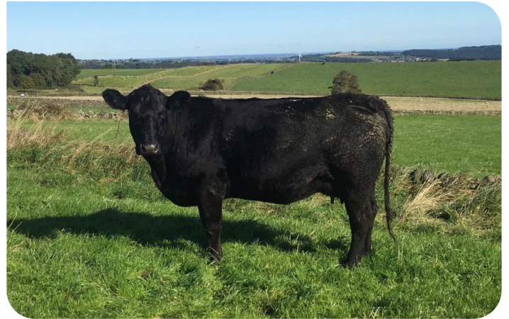
Netherton Fleur L650 (moeder van Franklyn)