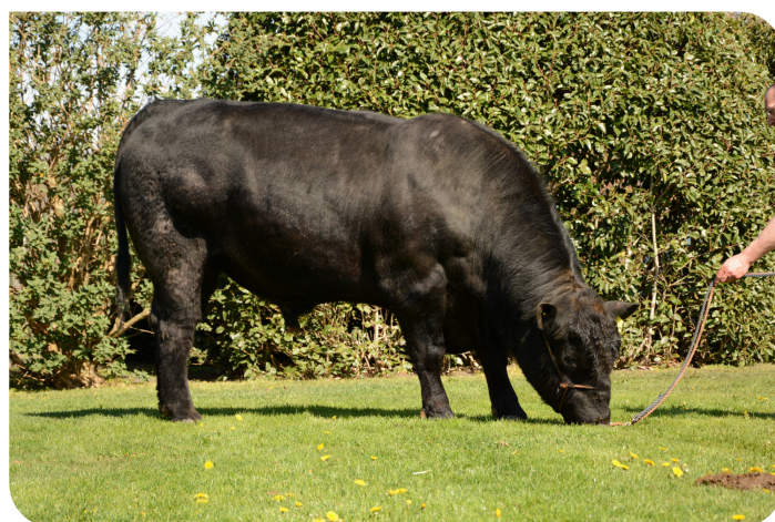
Roydmoor Franklyn T496