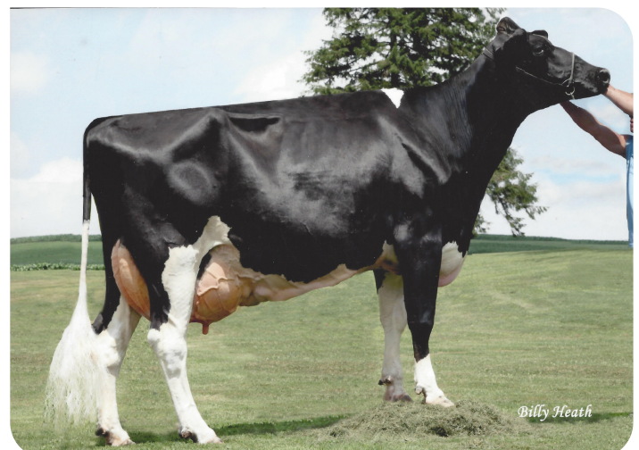
Elk-Lick Durhm Ardel Lea-ET (EX92) (grootmoeder van Radix-P rf)