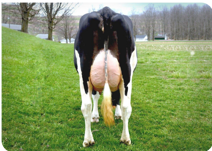
Scenic-Vista Ardels Raya-ET-P Volle zus van Radix-P rf Eig.: Scenic-Vista Farms, Western Maryland, USA