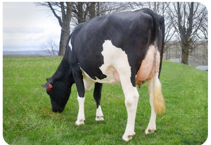
Scenic-Vista Ardels Raya-ET-P Volle zus van Radix-P rf Eig.: Scenic-Vista Farms, Western Maryland, USA