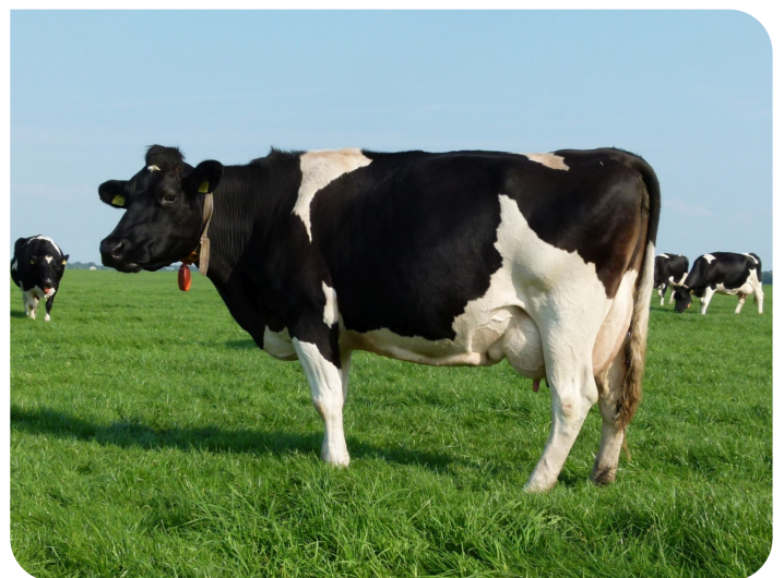
Setske 244 (moeder van Sem 17)