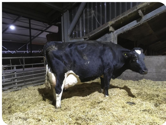
Elsje 184 (moeder van Silvester)