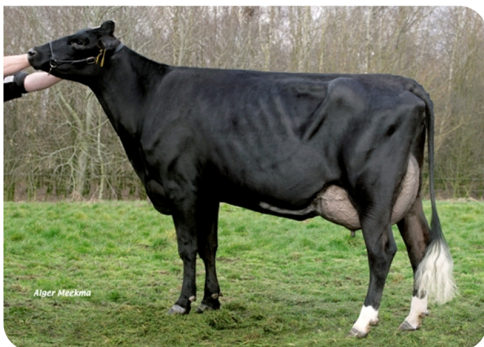
Pineut (AB 87) (v. Image) Eig.: Melkveebedrijf Engelen v.o.f.