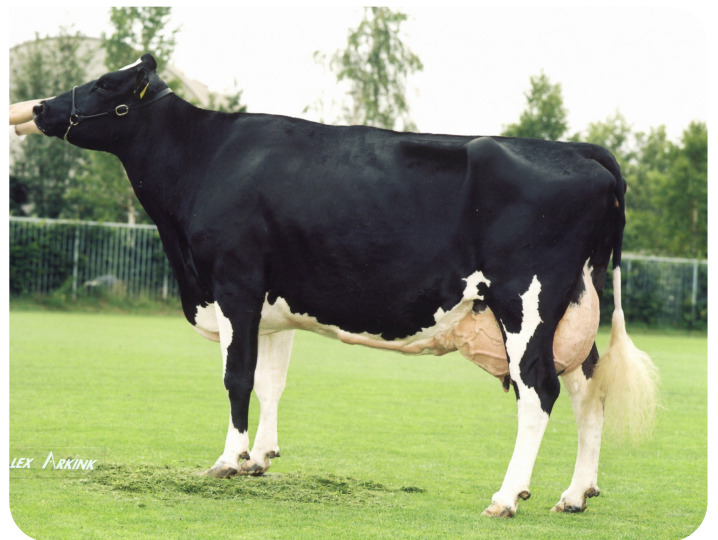
Geertje 289 (A 94) (moeder van Profile)