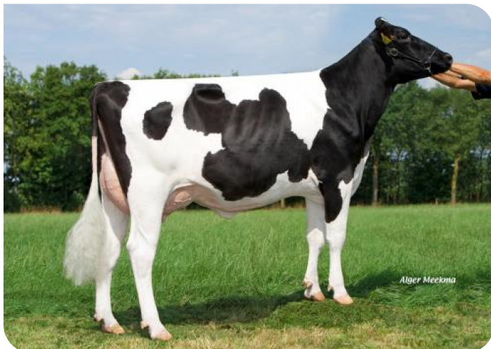
Grashoek Vrije Tulp 30 (v. Profile)

Eig.: Melkveebedrijf Grashoek b.v., Grashoek