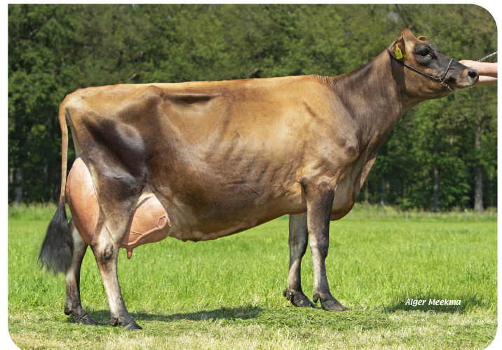
Missy 9490 (volle zus van Sullivan) (foto als 4de kalfs)