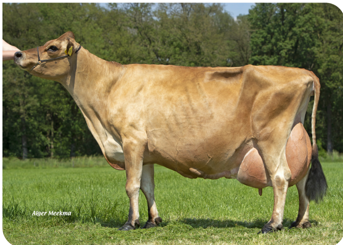
Missy 9157 (moeder van Sullivan)