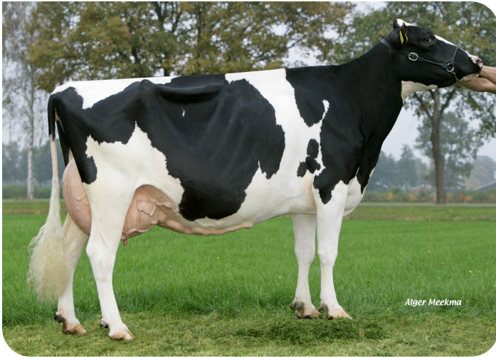
Quarrel 11 (AB 87) (moeder van Aquarel)