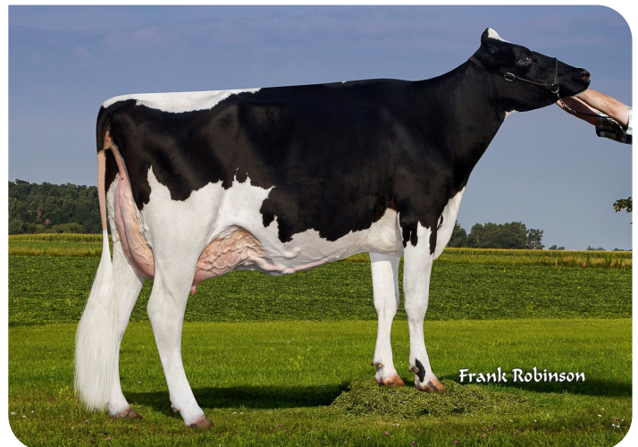
Golden-Rose Abs Gloriana Grootmoeder van Genesis