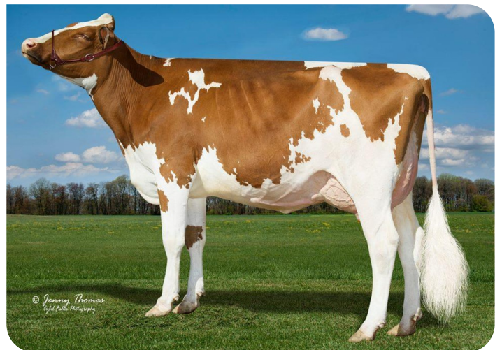
Golden-Rose Ladd Glory-Red (AB86) Moeder van Genesis