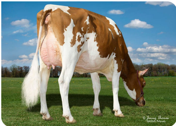
Golden-Rose Ladd Glory-Red (AB86) Moeder van Genesis