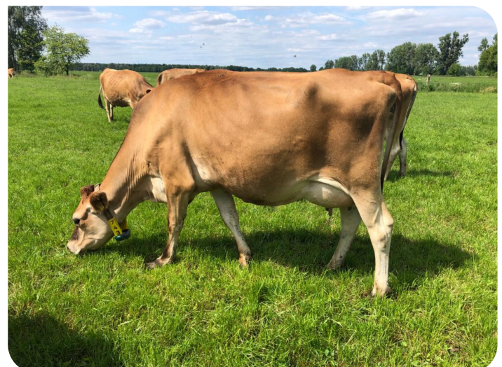
Dochter Napoleon (PP) Fig.: Ags. Bar. Urstromtal mbH & CoKG