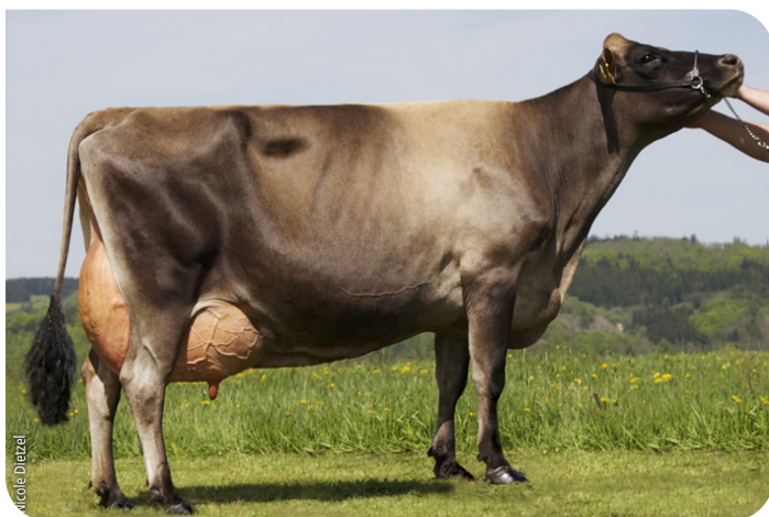
Scholz Evita (PP) (A 91) moeder van Napoleon PP