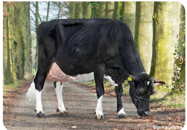
VDR Sandra 5 Moeder van Stravinsky