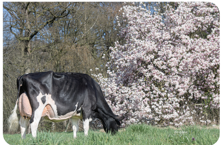
VDR Sandra 5 Moeder van Stravinsky