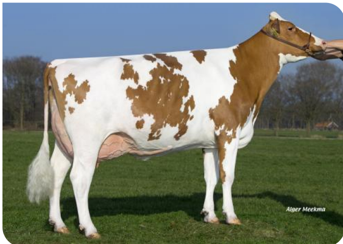
Dikkie 76 (v. Domax Red)