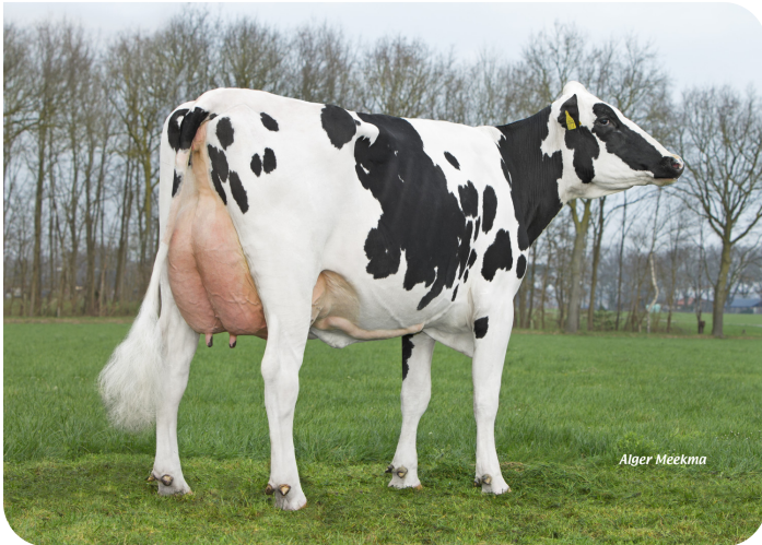
Grashoek Julia 92 (v. Repairman) Eig.: Melkveebedrijf Grashoek b.v., Grashoek