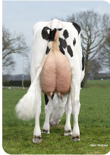
Achteraanzicht Grashoek Julia 92 (v. Repairman) Eig.: Melkveebedrijf Grashoek b.v., Grashoek