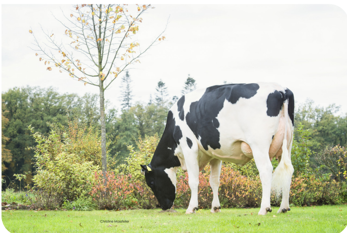
VDR Janny 143 (v. Repairman) Eig.: H.J. van de Riet, Markelo