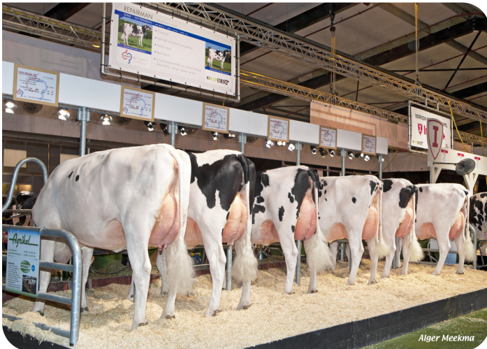
Dochtergroep Repairman Hardenberg 2018