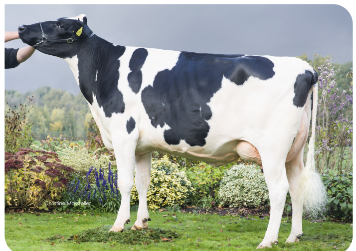
VDR Janny 143 (v. Repairman) Eig.: H.J. van de Riet, Markelo