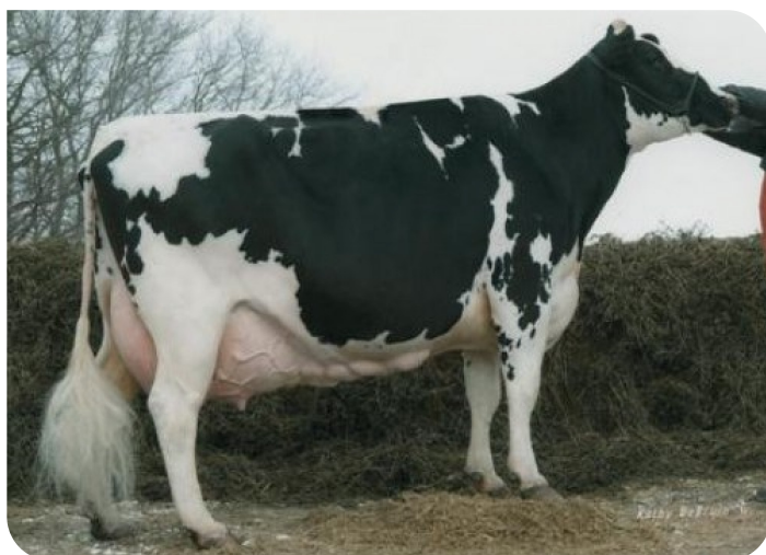
Schillview M Toto Geanie (EX 90) (grootmoeder van Gable)