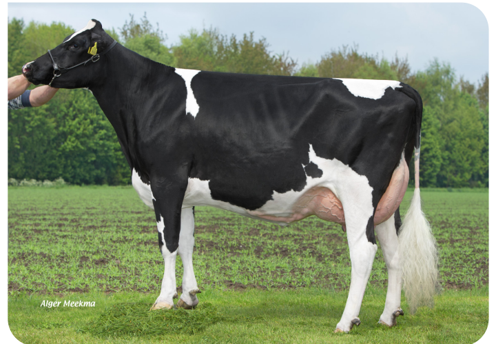
Grashoek Frida 81 (v. Ashburton) Eig.: Melkveebedrijf Grashoek b.v., Grashoek