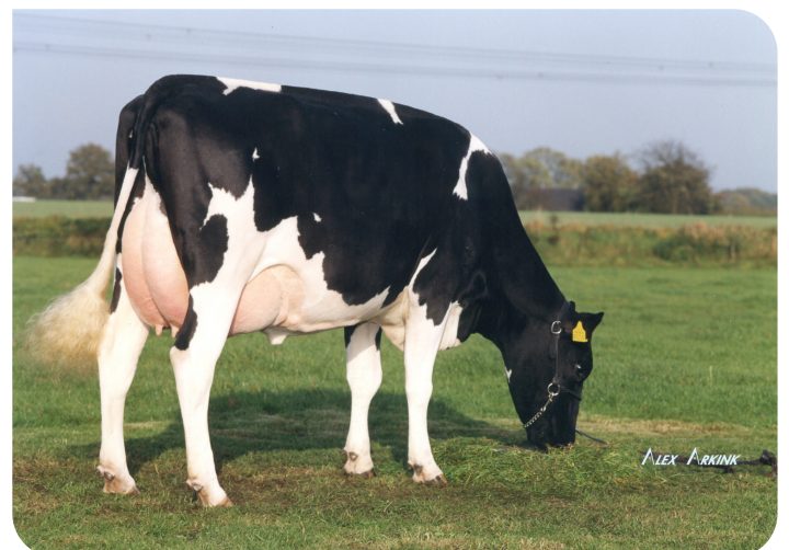
Weggelhorster Dirndel 24 (A 90) (grootmoeder van Ashburton)