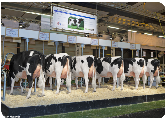
Dochtergroep Ashburton Hardenberg 2017