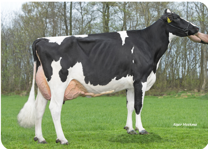
Maaike 360 (v. Ashburton) Eig.: Vreba Melkvee B.V., Vredepeel

2.00 317dg 10702kg 4.42% 3.51% 3.00 333dg 11154kg 4.88% 3.83% 4.00 299dg 10785kg 4.96% 3.79% 5.00 338dg 15122kg 4.66% 3.55% 6.01 373dg 17976kg 4.74% 3.62% 7.05 358dg 17387kg 4.55% 3.45% 8.07 427dg 14288kg 5.43% 3.71% 91 90 89 A 90