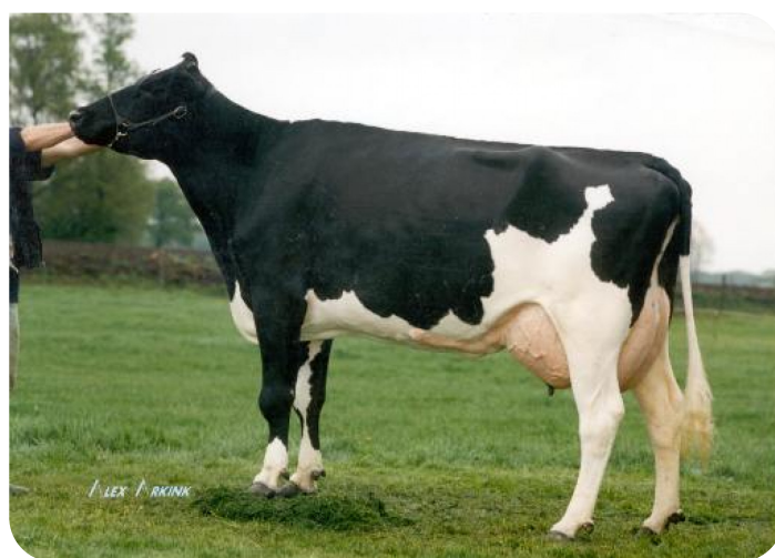
Hannita 34 (AB 89) (grootmoeder van No Doubt rf)