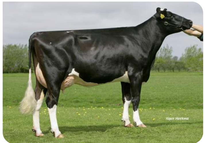
Carla 339 (v. Erwin WH) Eig.: Firma J.C. Wester, Opmeer