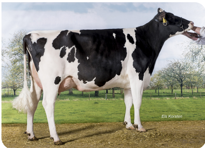
Bea 154 (v. Xtrem rf) Eig.: Mts. van Wijk-van der Gun, Beusichem

2.03 460dg 14244kg 3.96% 3.61% 4.09 436dg 16440kg 4.16% 3.61% 6.02 406dg 16480kg 4.37% 3.48% 92 91 88 84 AB 88