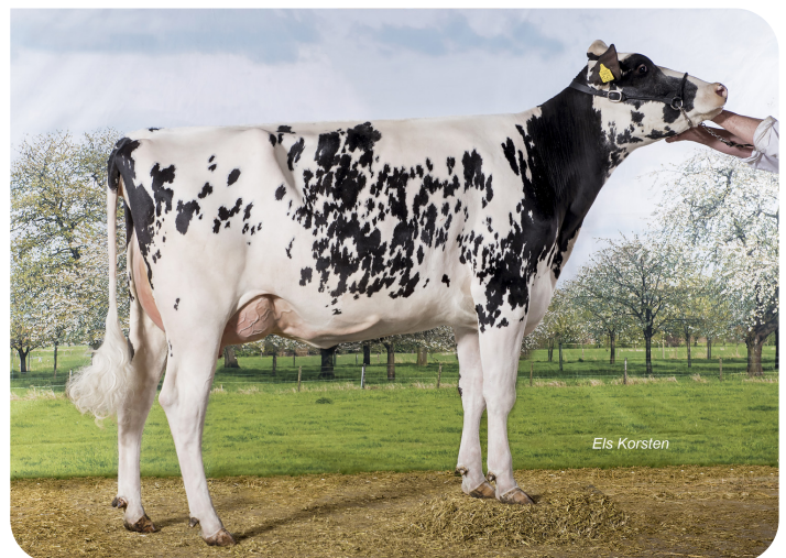
Willem's Hoeve Rita 1562 (v. Xtrem rf) Eig.: Firma D. de Jong en Zoon, Buren