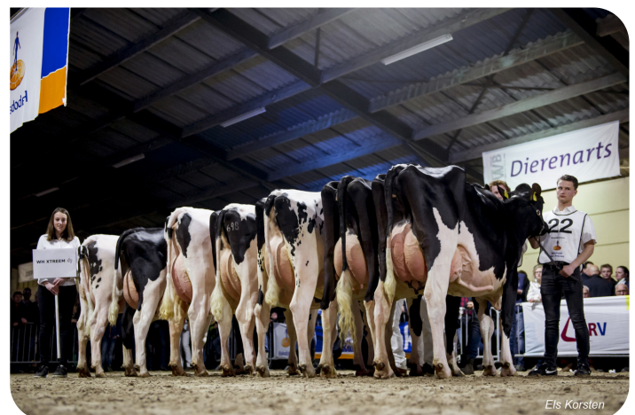
Dochtergroep Xtrem WH rf Bloesemshow Zoelen 2018