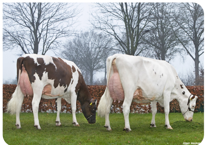
Wilskracht Warsi 1112 (Moeder van Allianz P)