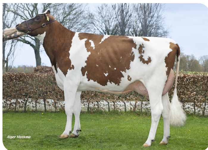
Wilskracht Warsi 1319 P (AB 87)