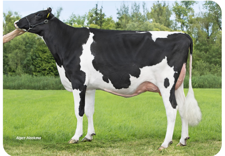
Empore 1 (v. Centrum) Eig.: V.O.F. J.J.C. de Man, Herwijnen