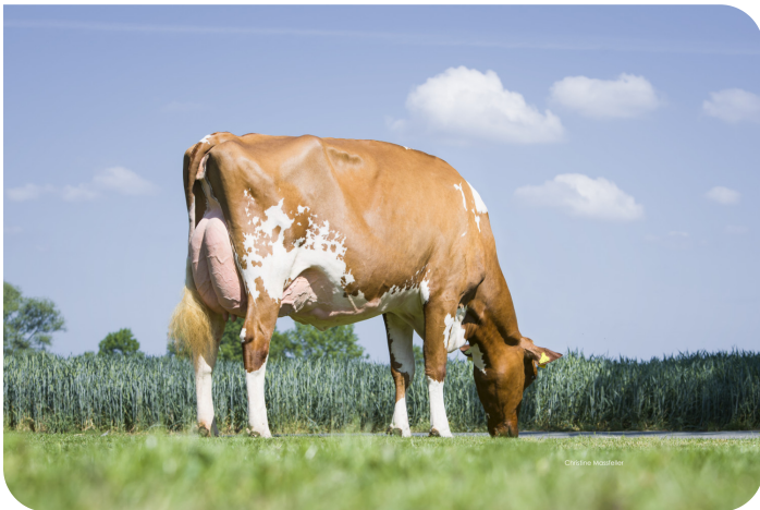
WR Miley (EX 92) Moeder van Centrum