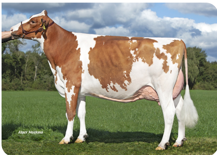
Grashoek Julia 123 (v. Centrum)

Eig.: Fok- en melkveebedrijf K.I. Samen B.V., Grashoek