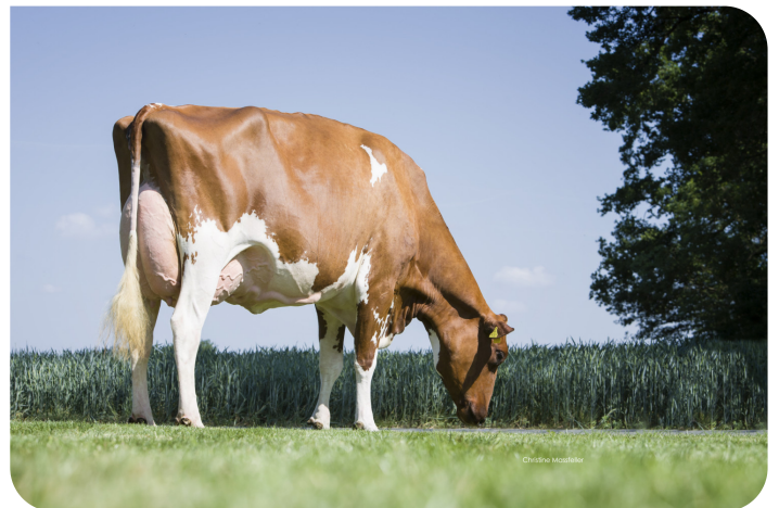
WR Monroe (EX 90) Grootmoeder van Centrum