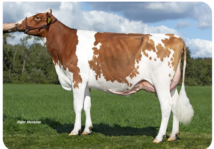
Grashoek Groliena 43 (v. Centrum) Eig.: Fok- en melkveebedrijf K.I. Samen B.V., Grashoek