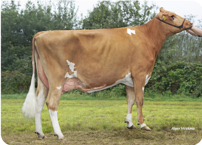
Lian 482 (v. Centrum) Eig.: V.O.F. van Mensvoort, Berkel-Enschot