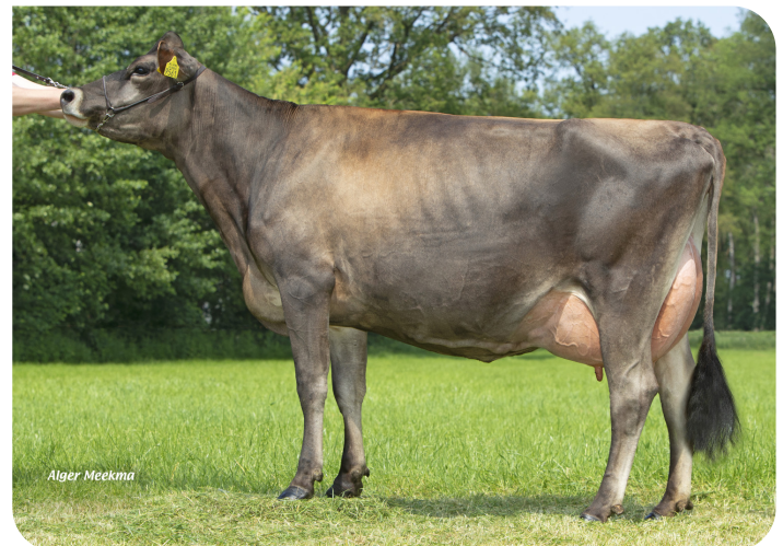
Jessy 9561 (v. Trenton Pp) Eig.: Mts. ter Mors, Haakbergen