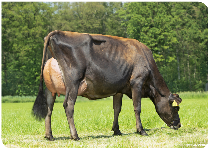
Annejet 9578 (v. Trenton Pp) Eig.: Mts. ter Mors, Haakbergen