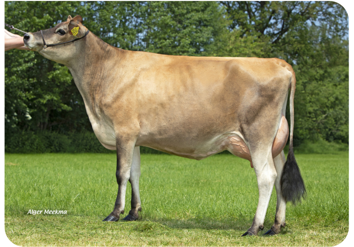
Missy 9581 (v. Trenton Pp) Eig.: Mts. ter Mors, Haakbergen