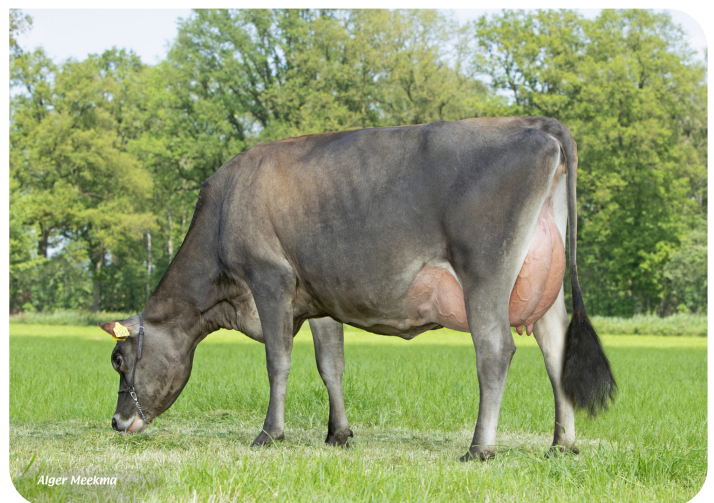
Jessy 9561 (v. Trenton Pp) Fig.: Mts. ter Mors, Haakbergen