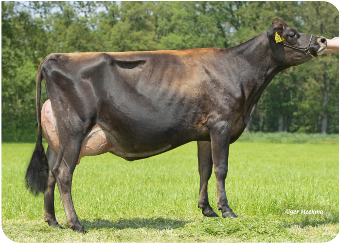
Annejet 9578 (v. Trenton Pp) Eig.: Mts. ter Mors, Haakbergen